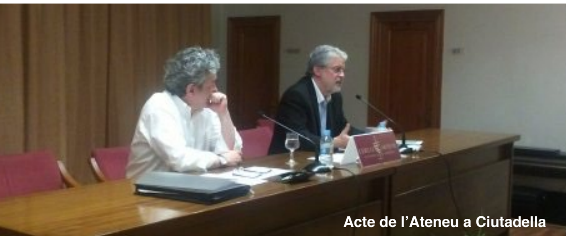
Acte de l'Ateneu a Ciutadella

- S'ha començat a planificar les tasques que ens garanteixi el normal funcionament de la Fundació, tant des del punt de vista legal i burocràtic com de finançament. La consecució d'aquest objectiu és un dels grans reptes del proper curs polític.