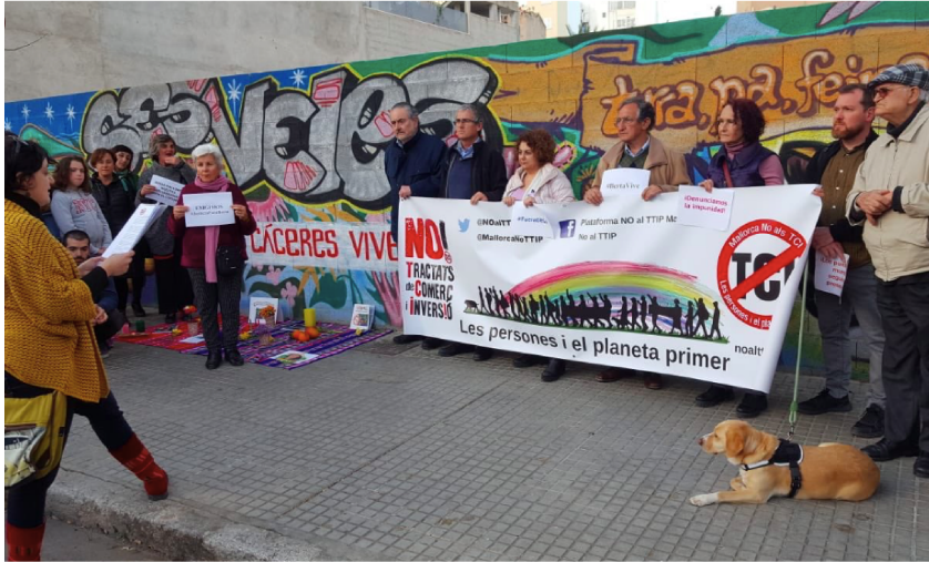
Homenatge a Berta Càceres. Plataforma NO als TCI.

-Canvi nom de la plataforma. Contra els tractats neoliberals de comerç i inversió. Les Fundacions renoven el seu compromís amb el nou enfocament de la Plataforma. Presentació nou manifest 22 gener 2019.