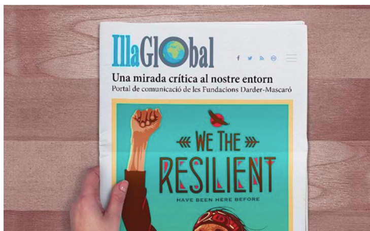
Una imatge de www.IllaGlobal.com , el nou portal comunicatiu impulsat per les fundacions.

Hem començat a fer algunes experiències amb audiovisuals i hem seguit amb la WEB i la presència a xarxes socials.