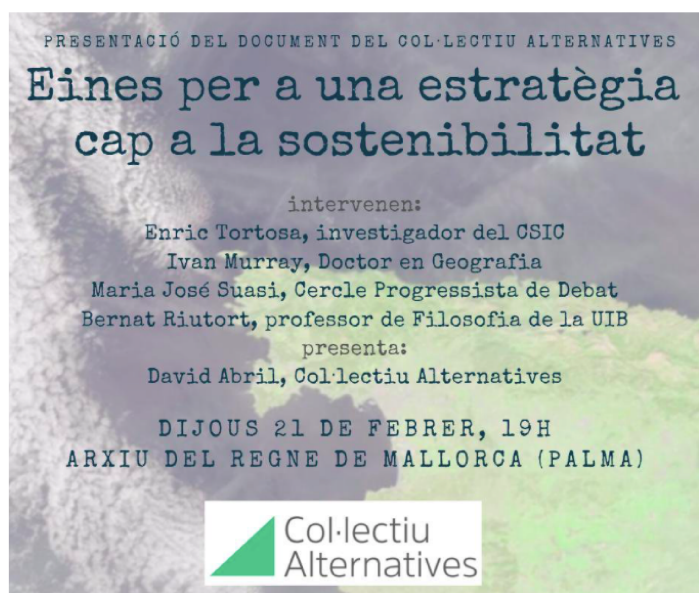
Cartell de l'acte de presentació del darrer estudi del Col·lectiu sobre indicadors de sostenibilitat

lectiualternatives.cat , la publicació del llibre “ Eines per a una estratègia cap a la sostenibilitat” sobre indicadors de sostenibilitat, que es presentà el 21 de febrer de 2019, la redacció d’una carta demanant a l’IBESTAT que incorpori aquests indicadors a les estadístiques oficials. Presentada pel Col·lectiu al Consell Assessor d’estadística de la CAIB el 20 de mars de 2019, l’entrevista del Col·lectiu Alternatives amb el conseller de Treball i l’enviament als partits d’esquerra d’un document sobre uns punts mínims sobre planificació estratègica que es pensa que han d’estar en els nous Acords pel Canvi.