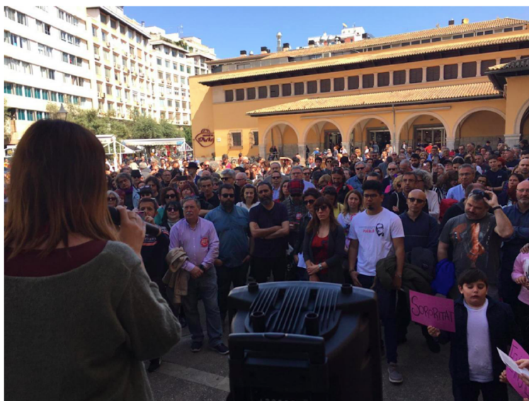
Una de les mobilitzacions contra el racisme i el feixisme impulsades per la Plataforma per la Democràcia

Al començament de les campanyes electorals vàrem fer una crida als partits polítics contra els autoritarismes i els feixismes i esbva decidir que després de les eleccions continuaria la seva activitat.