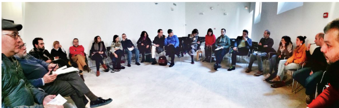
Imatge del darrer Foro de Fundacions celebrat a Palma

A les Fundacions Darder Mascaró ens va correspondre organitzar el IV Foro de Fundacions Sobiranistes, amb el títol « Sobiranes en acció: Democràcia front a autoritarismes » els dies 28 i 29 de desembre en el marc de la celebració de la Diada de Mallorca.