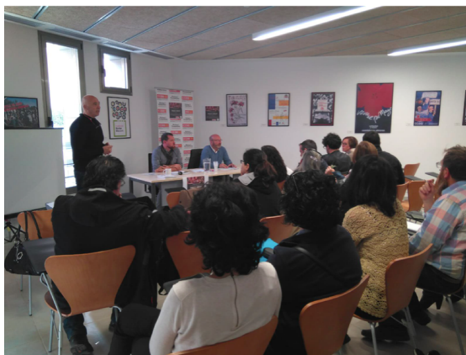
Curs de formació sindical a Eivissa

Però allò més important ha estat l'inici de cursos de formació per afiliats/des i quadres de CCOO que hem organitzat conjuntament amb aquest sindicat i el compromís de donar-li continuïtat a aquesta tasca. Igualment, el compromís adquirit entre STEI i Fundacions per iniciar cursos de formació a partir de la tardor.