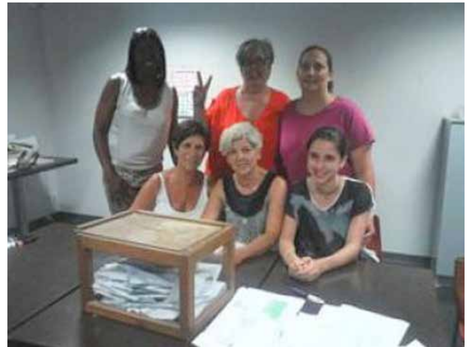
Treballadores Hotel Sumba

• Correspon als propis sindicats valorar els encerts i les mancances que reflecteixen les dades electorals. Especialment els reptes que suposa pel sindicalisme les transformacions accelerades del mercat laboral arran de les darreres reformes laborals. Les eleccions sindicals representen a una part molt important de la classe assalariada, la més conscient, la més organitzada i la més estable laboralment. Però no s'arriba a totes les bandes on s'hauria d'arribar, i molta gent assalariada i aturada, no té dret a tenir representants propers que els representin. Com organitzar millor els assalariats on es tenen delegats, i com arribar als altres assalariats sense representació, són temes claus per enfortir el paper del sindicalisme i perquè aquest contribueixi com cal, a la dinamització de la societat civil de les Illes, per a la vegada reforçar en el seu conjunt, a les polítiques de progrés.