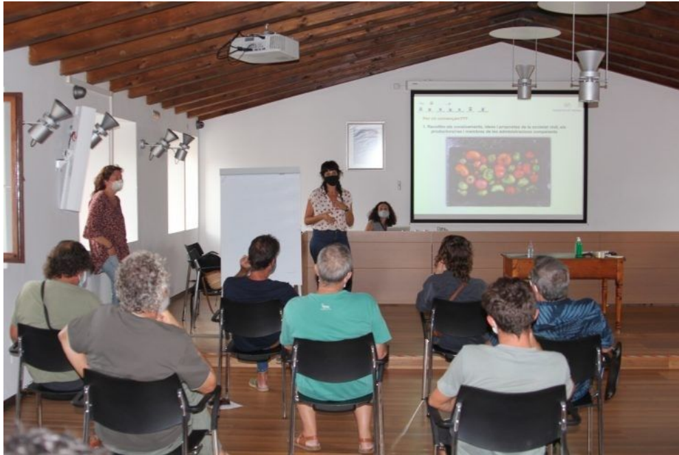
Reunió a Esportes (17-09-2020)

De cara a engegar el projecte amb un pla d'acció concret s'ha convocat als grups motors de tots els pobles per a de manera conjunta prioritzar les accions a dur a terme a nivell de producció, de comercialització/distribució i de sensibilització/dinamització a curt, mitjà i llarg terme. D'aquesta manera s'ha creat una proposta pràctica d'intervenció en el territori que engloba un ampli ventall d'accions i activitats encaminades a promoure la sostenibilitat, l'equitat i la justícia en els sistemes alimentaris i les comunitats locals.