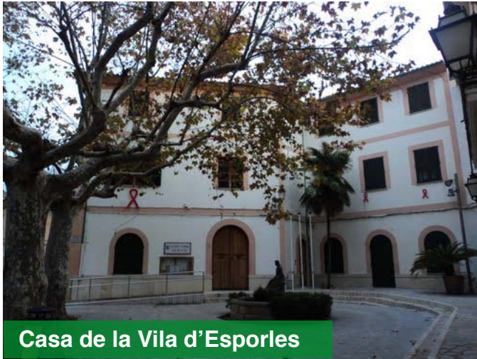
Casa de la Vila d'Esporles

Tot això des d'un projecte de llei que no ha estat consensuat entre partits polítics, la FEMP, i les distintes federacions de municipis autonòmiques. Solament té el suport del PP i no de tot, com cada dia se posa en evidència a través dels mitjans de comunicació.