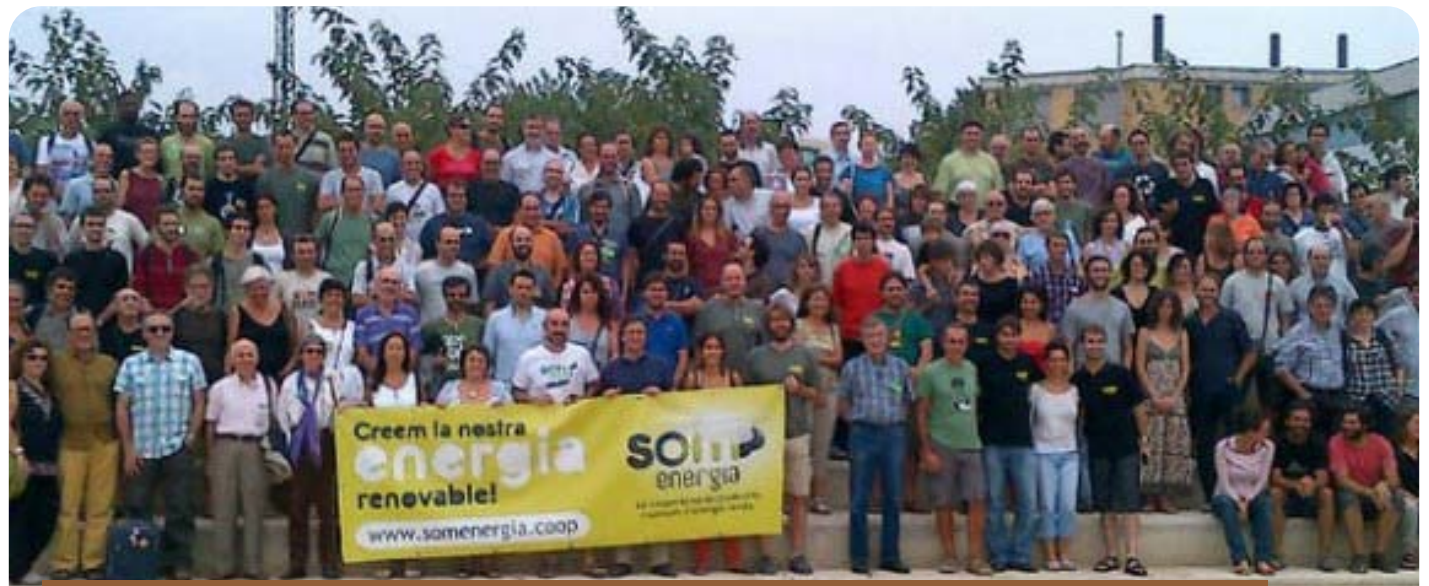
El Grup Local de Som Energia a Mallorca el 26 d'octubre va fer un any a Palma

Els socis de la cooperativa paguem la factura de la nostra despesa elèctrica a SOM Energia que a la vegada compra aquesta a les distribuïdores d'energies renovables. Així mateix destina els beneficis i la inversió dels socis que ho desitgen a crear plantes d'energies renovables, a pesar de les greus dificultats que està posant, cada cop més, la legislació vigent.